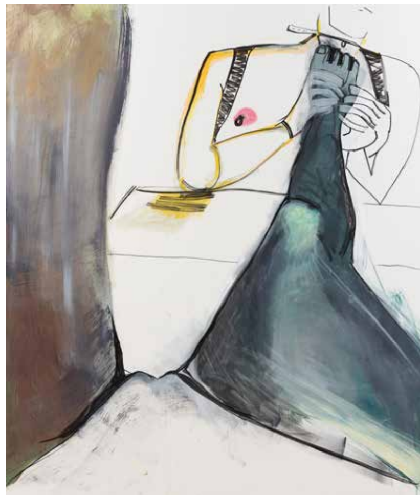
אפרת רובינשטיין, רויאל ג'לי , 2020, אקריליק על בד, 200/200 Efrat Rubinstein, Royal Jelly , 2020, acrylic on canvas, 200/200