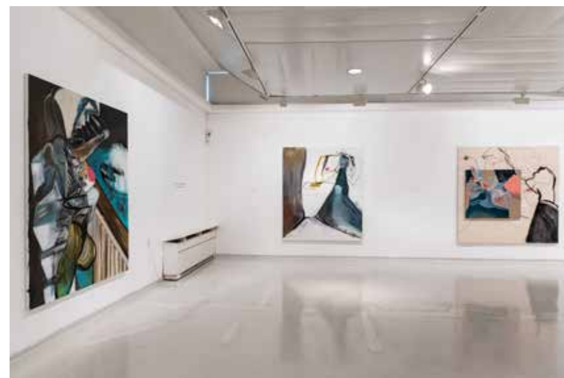
אפרת רובינשטיין, מבט הצבה Efrat Rubinstein, Installation V view