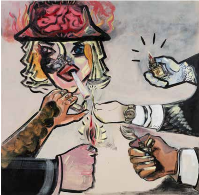
אפרת רובינשטיין, פעמוני הגהנום , 2019, אקריליק על בד, 200/200 Efrat Rubenstein, Hells Bells , 2020, acrylic on canvas, 200/200