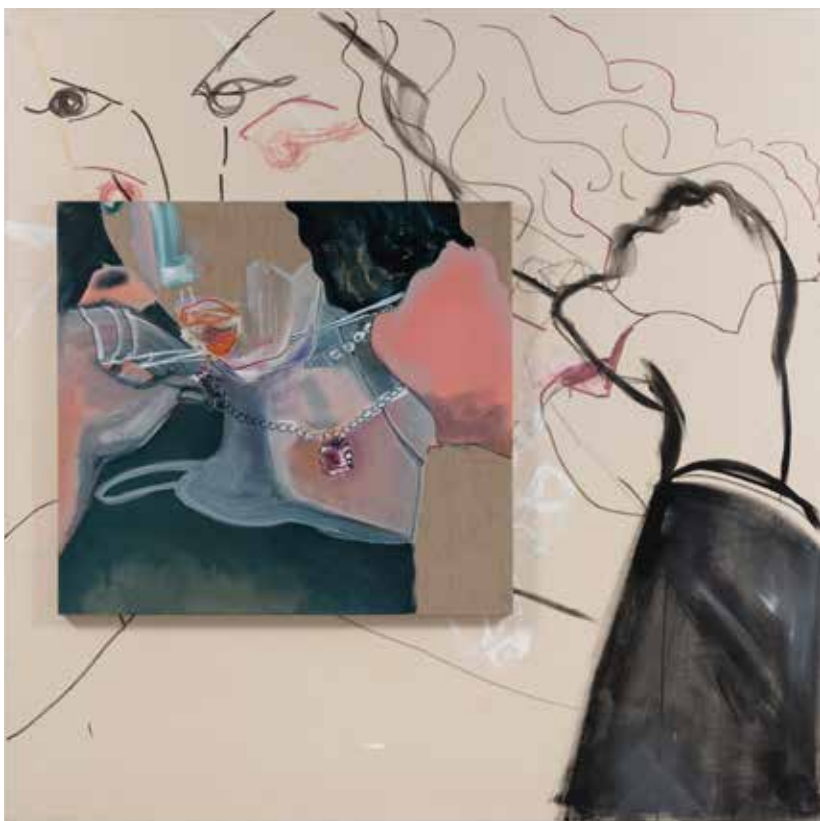
אפרת רובינשטיין, סנטר כפול , 2020, מדיה מעורבת על בד, 200/200 Efrat Rubinstein, Double Chin , 2020, mixed media on canvas, 200/200