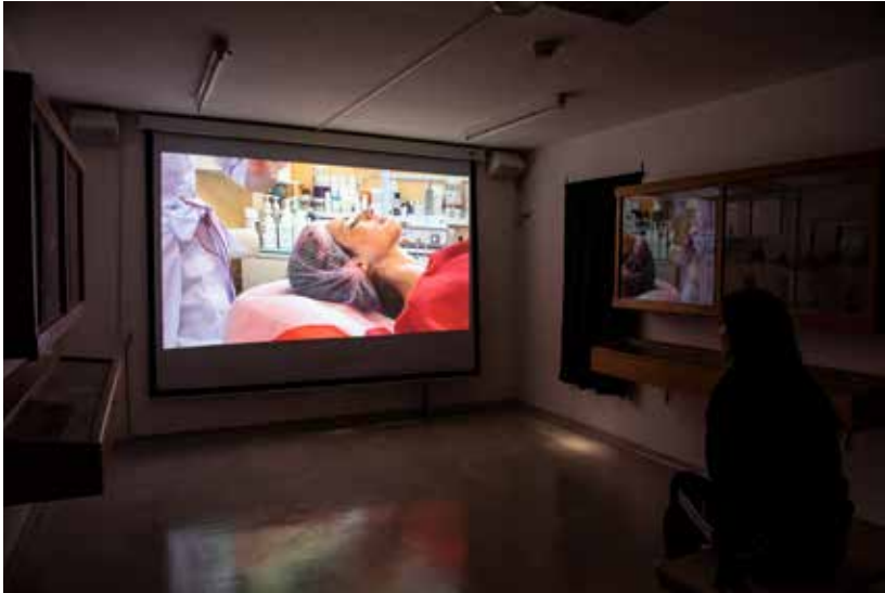
מיצב וידאו "גונדולה" Video installation, "Gondola"