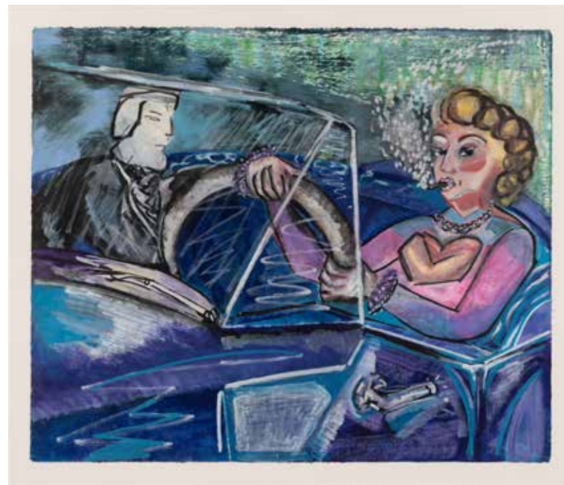
אפרת רובינשטיין, נוסע מרגיז , 2019, אקריליק, פסטל שמן ומדגיש על נייר, 78/90 Efrat Rubenstein, Irritating Passenger , 2019, acrylic oil pastel and markers on paper, 78/90