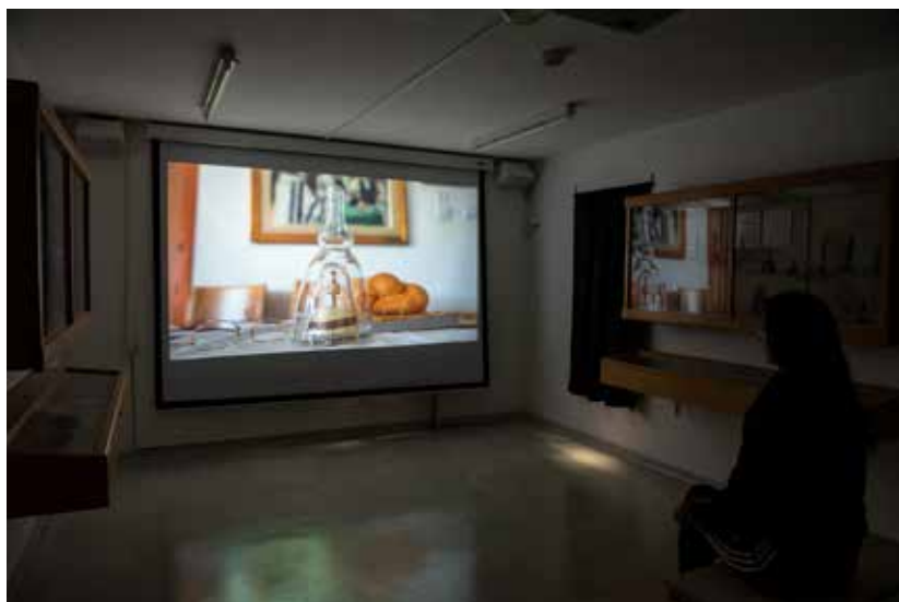
מיצב וידאו "גונדולה" Video installation, "Gondola"