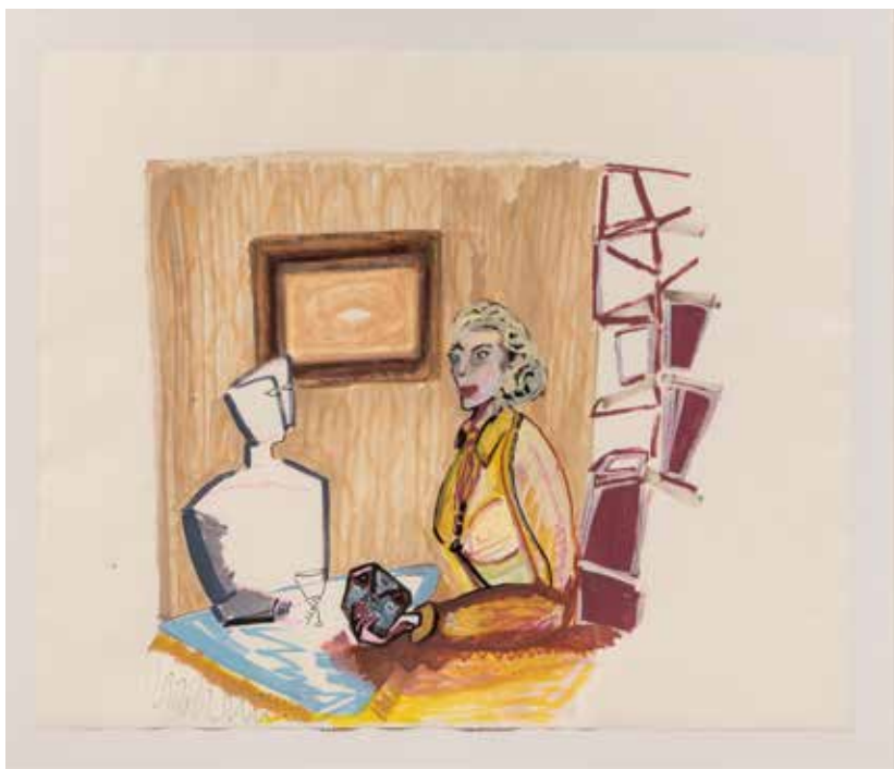
אפרת רובינשטיין, העלם , 2020, אקריליק על בד, 200/200 Efrat Rubinstein, Be Gone , 2019, acrylic and markers on paper, 90/78