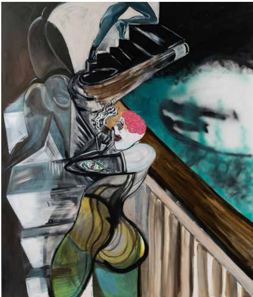
אפרת רובינשטיין, עירום עולה , 2020, אקריליק וספריי על בד, 170/200 Efrat Rubinstein, Nude Rises , 2020 acrylic and spray paint on canvas, 170/200