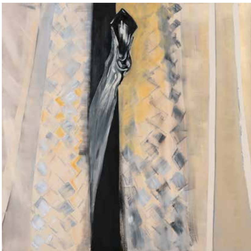
אפרת רובינשטיין, נרכס מקדימה , 2020, אקריליק על בד, 200/200 Efrat Rubinstein, Front Fastening , 2020, acrylic on canvas, 200/200