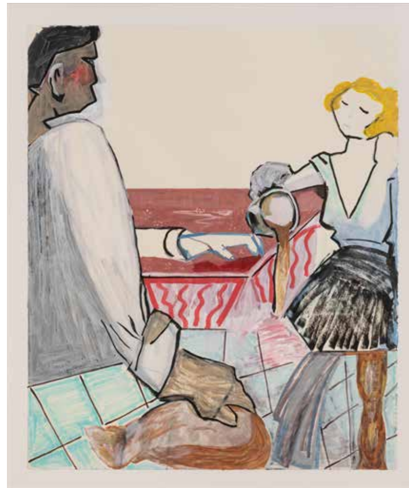
אפרת רובינשטיין, הרסת את זה , 2019, אקריליק ומדגיש על נייר, 85/68.5 Efrat Rubinstein, You Ruined It , 2019 acrylic and markers on paper, 85/68.52