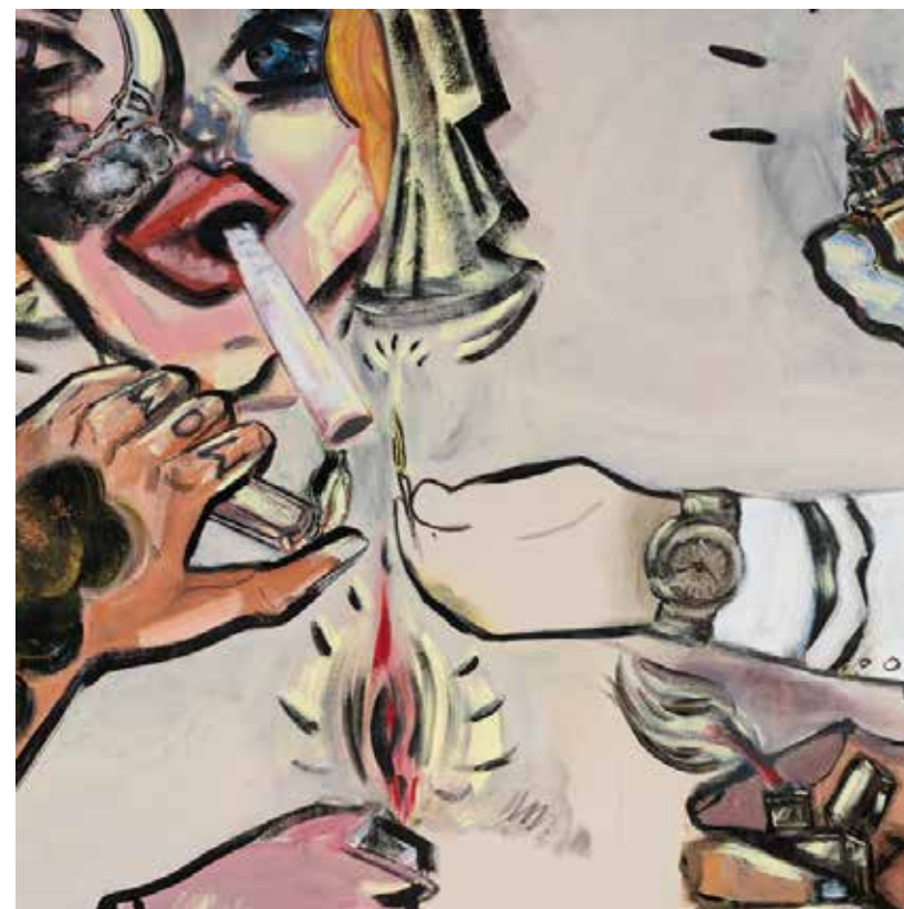
אפרת רובינשטיין, פרט מתוך פעמוני הגהנום, 2019, אקריליק על בד, 200/200 Efrat Rubenstein, Detail from Hells Bells , 2020, acrylic on canvas, 200/200